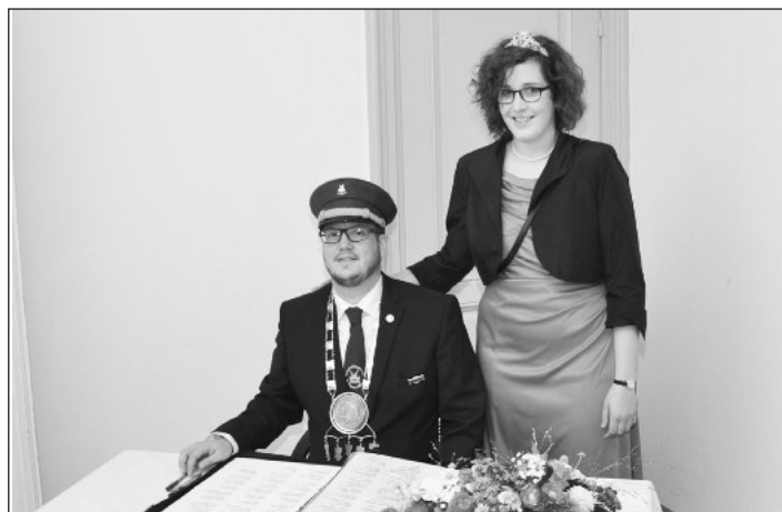
Das Kaiserpaar trägt sich in das Buch der Schützengemeinschaft ein.