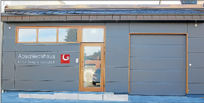
Das neue Abschiedshaus an der Brechtestraße