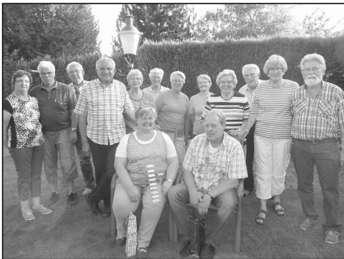
Das Königspaar mit seinem Gefolge