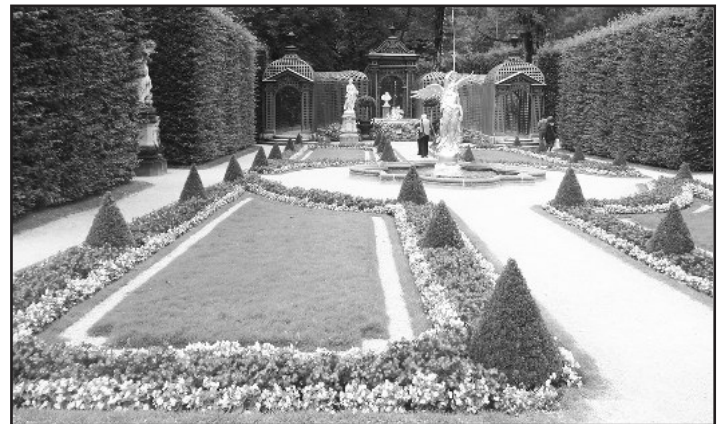
Sehenswerte Parkanlagen wurden besichtigt