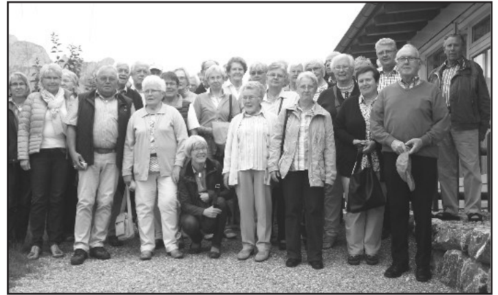
Die Teilnehmer der Allgäufahrt der KAB St. Elisabeth