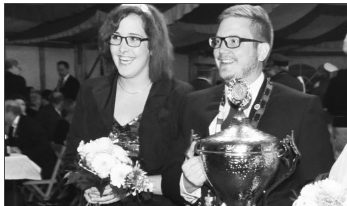
Das Kaiserpaar 2015 nach der Proklamation mit Pokal